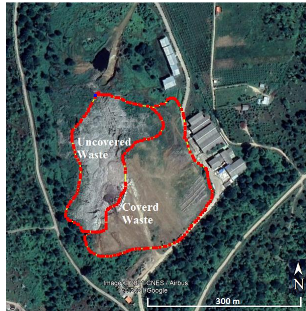
Fig. 4. The location of the Babol Anjilsi landfill in Google Earth

در بخش فرانت‌اند ۲ مدل محاسب، از چارچوب nextjs که توسط شرکت vercel توسعه داده شده، استفاده شده است.