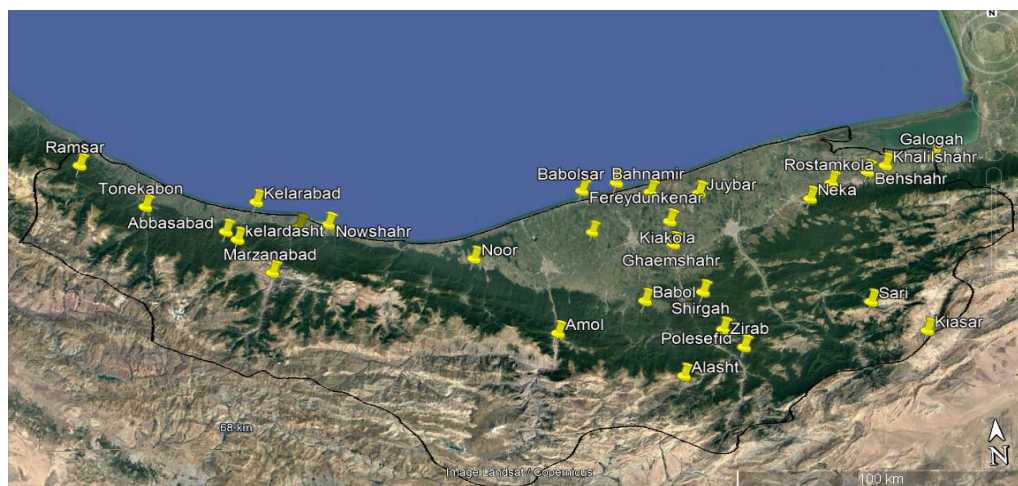
Fig. 2. The geographical location of 27 landfills in Mazandarn province in Google Earth