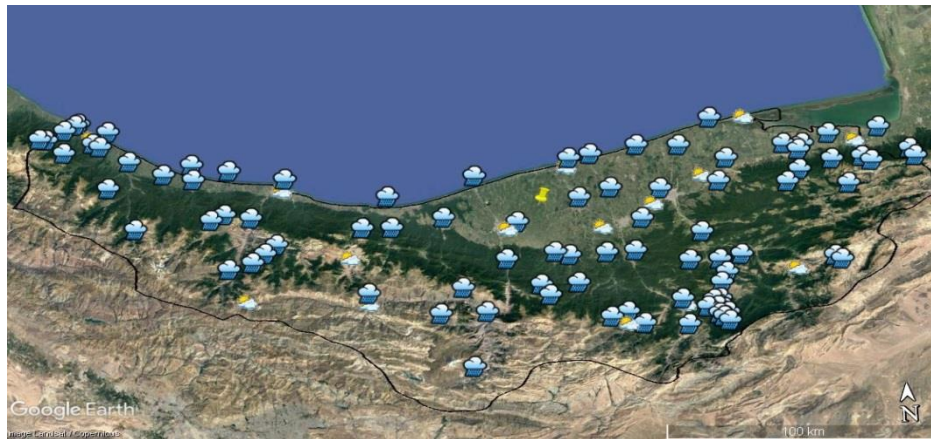
Fig. 3. The location of the synoptic station and weathering station for the ministry of energy شکل ۳- موقعیت ایستگاه‌های هواشناسی سینوپتیک و ایستگاه‌های وزارت نیرو در استان مازندران

جدول ۴- میانگین تبخیر ماهانه ایستگاه‌های مجاور مراکز دفن زباله‌های شهرهای استان مازندران