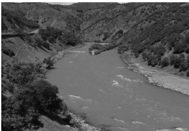
شکل ۱- نمایی از سیمای عمومی رودخانه زاب

در دبی، محیط خیس شده به سرعت کاهش می‌یابد و بعد از این نقطه، تغییرات زیاد دبی منجر به تغییراتی اندک در محیط خیس شده می‌شود [۶ و ۱۳]. بر این اساس محیط زنده به دبی‌های بالاتر از نقطه بحرانی حساس نبوده، ولی به همان نسبت به دبی‌های پایین‌تر از خود حساسیت نشان می‌دهد. بنابراین اگر دبی حد بحرانی در رودخانه‌ای تأمین شود، می‌توان ادامه حیات اکولوژیکی آن رودخانه را تضمین کرد [۱۳].