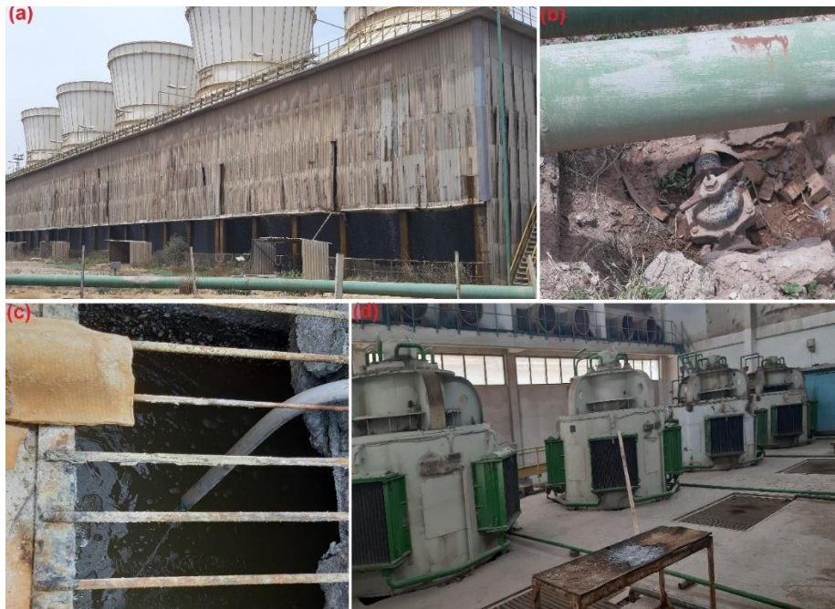
Fig. 1. a) Cooling tower, b) bleach injection line, c) H_2SO_4 injection line and d) pumps for transferring water to condenser

شکل ۱- a) برج خنک‌کننده، b) لاین تزریق آب کلر، c) تزریق اسید سولفوریک و d) پمپ‌های انتقال آب به کندانسور