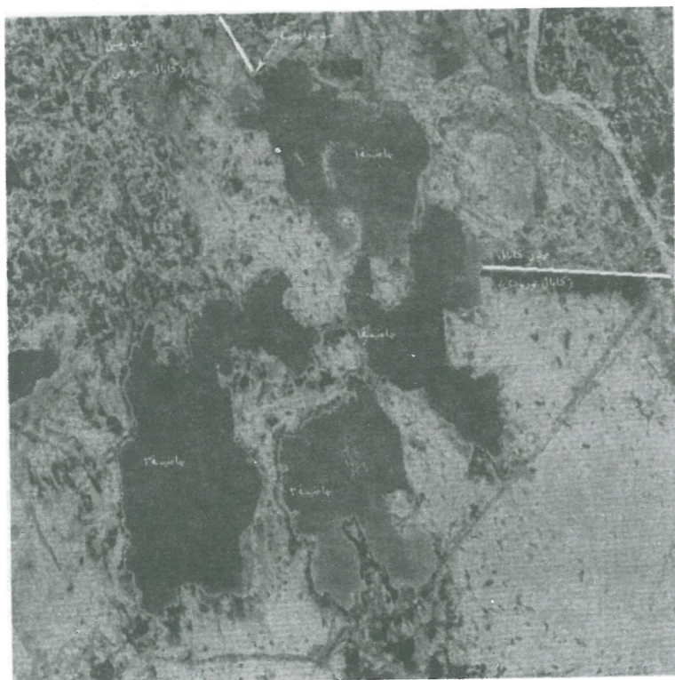
شکل ۲- تصویر ماهواره‌ای مخازن چاه نیمه ۱ تا ۳ در سال ۱۹۹۸

مخازن چاه نیمه دارای شرایط ویژه‌ای است که سبب استفاده مؤثرتر از روش بیان آبی برای تخمین تبخیر در این سیستم آبی می‌گردد. شرایط ژئوتکنیکی بستر و کناره‌های این مخازن نشان از وجود لایه‌های رس سیلتی می‌باشد، که این لایه‌ها میزان نفوذ و تراوش زیرزمینی از مخازن را تا حد زیادی کاهش می‌دهد، تا آن‌جا که صرف‌نظر کردن از میزان ورودی‌ها و خروجی‌های