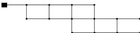
Fig. 2. Looped network شکل ۲- شبکه حلقوی شده

ندارد، ضریب حداکثر ساعتی از محاسبات حذف و دبی حداکثر روزانه به شکل زیر محاسبه می‌شود