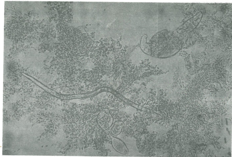
شکل ۱: تصویر معمول یک فلاک