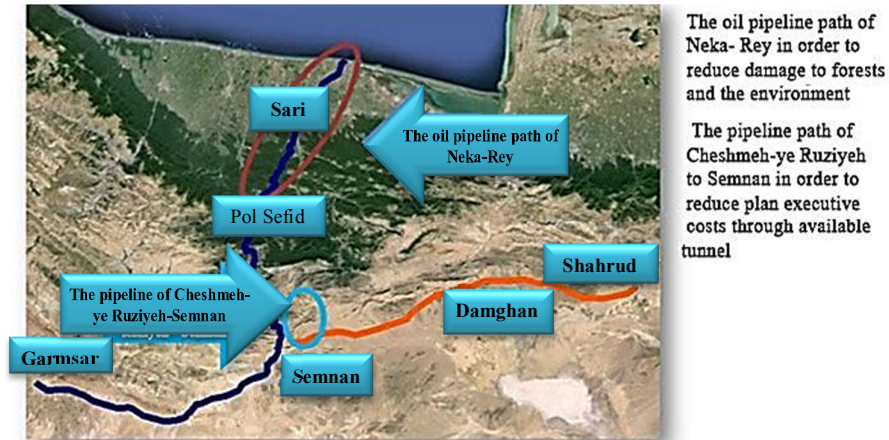
Fig. 1. Suggested general plan for water transfer

شکل ۱- پلان کلی مسیر پیشنهادی طرح انتقال آب